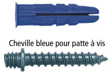
Cheville bleue pour patte à vis