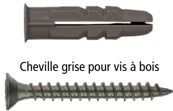
Cheville grise pour vis à bois

Le bon choix de la vis : Longueur de la vis = Longueur de la cheville + épaisseur à fixer + diamètre de la vis